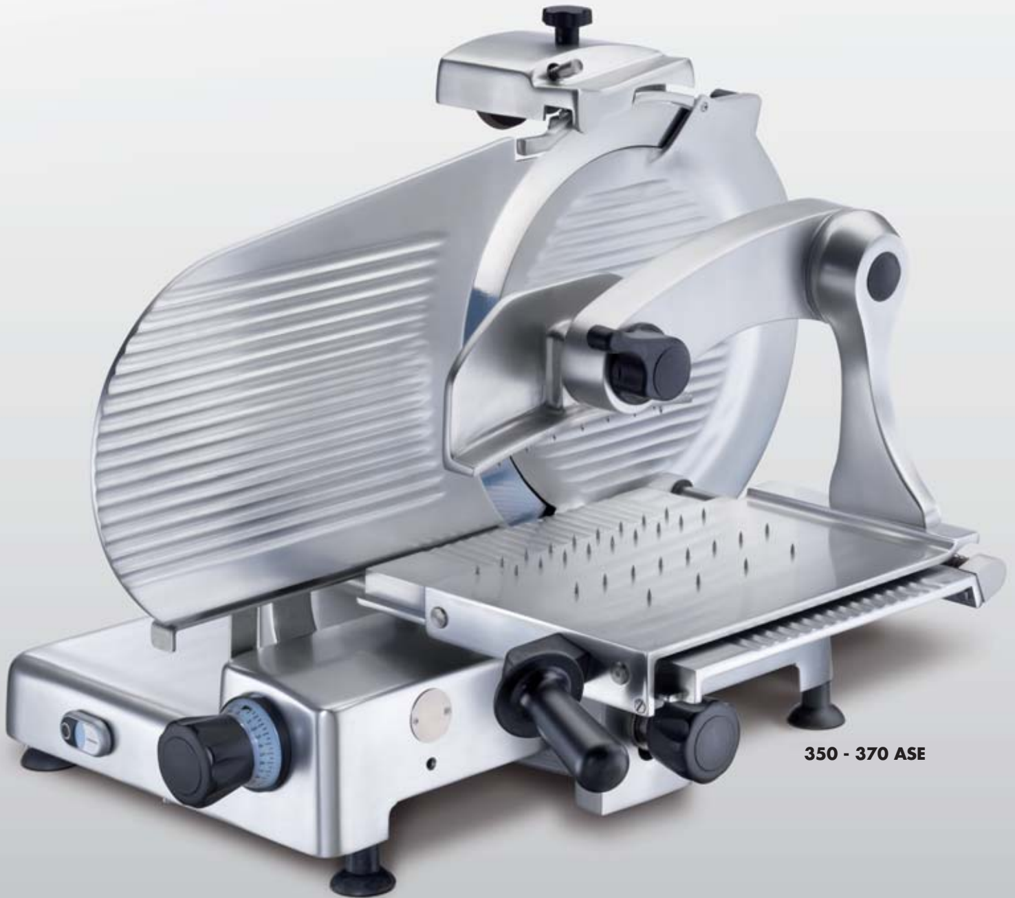
350 - 370 ASE