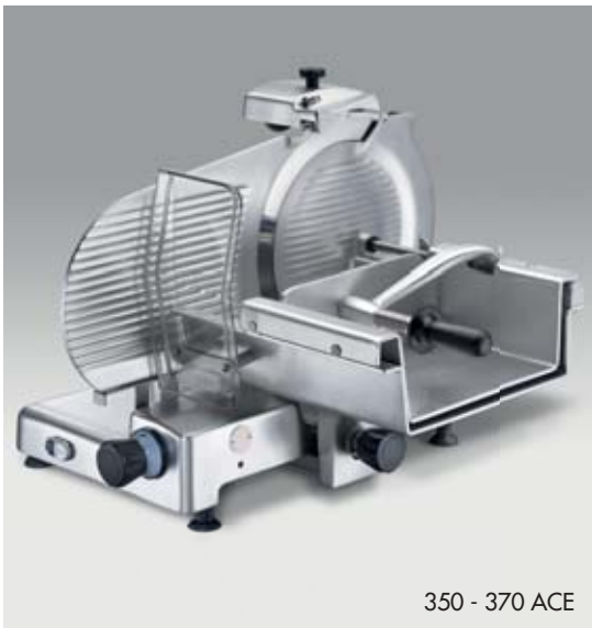
350 - 370 ACE