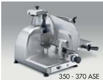
350 - 370 ASE